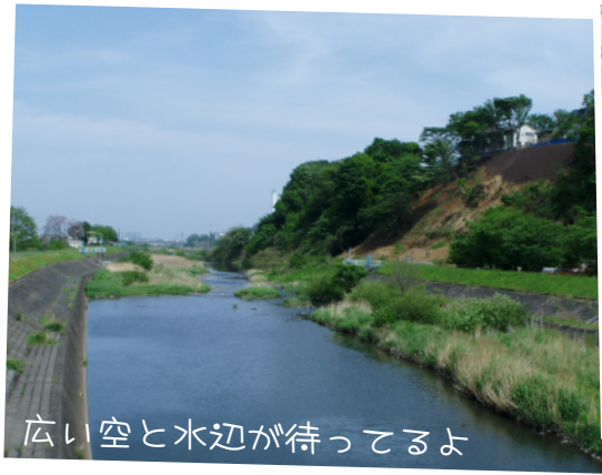
広い空と水辺が待ってるよ