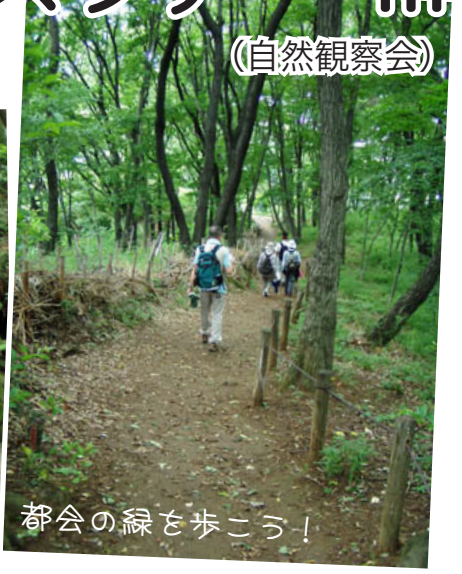
都会の緑を歩こう！