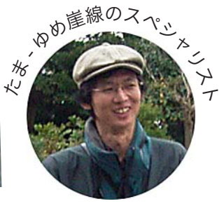
たま - ゆめ崖線のスペシャリスト