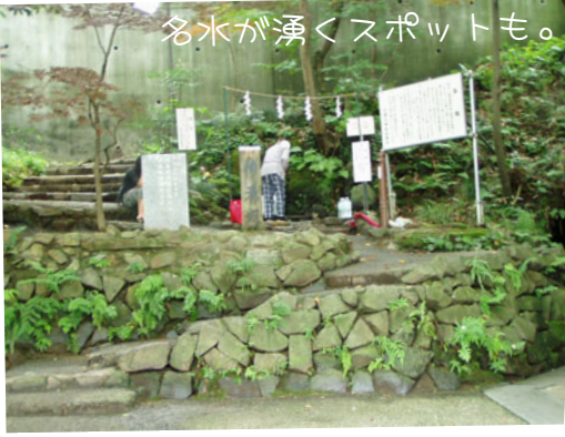
名水が湧くスポットも。