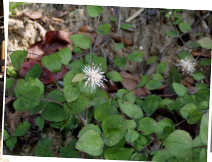
秋の生きもの、いっぱい！