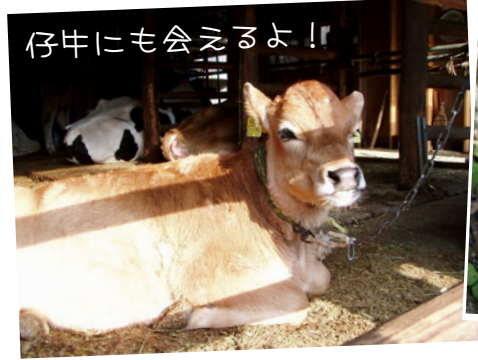
仔牛にも会えるよ！